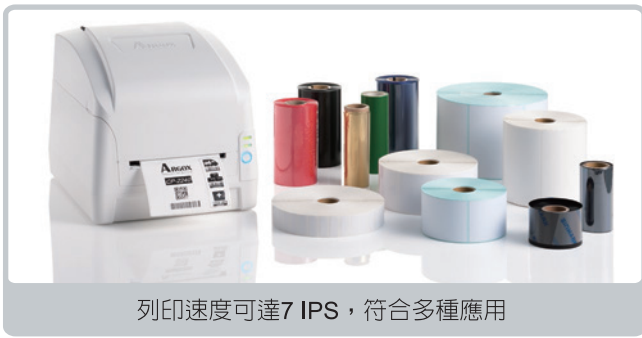
列印速度可達7 IPS，符合多種應用